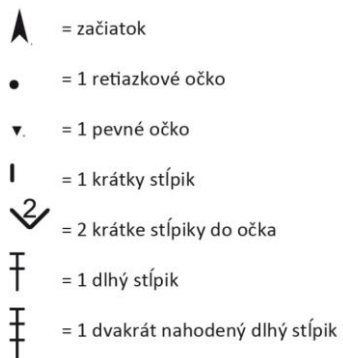
Schéma = ozdoba hviezda