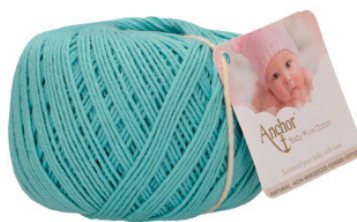
Anchor Baby Pure Cotton